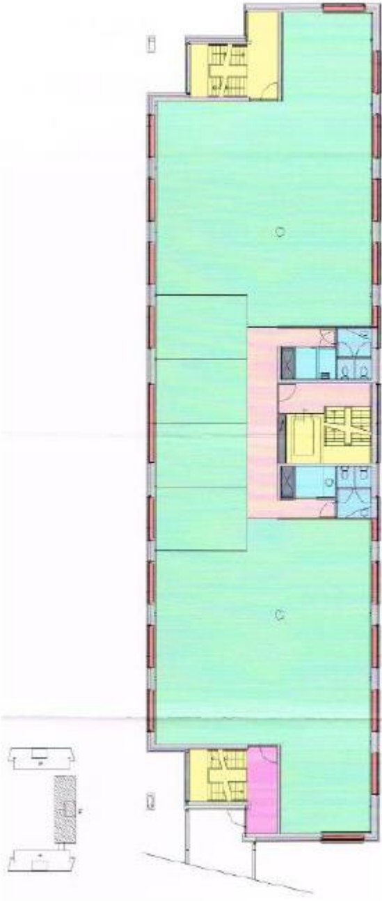
Plattegrond Gebouw B – 1 e verdieping